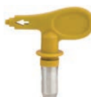
DYSE TRADE TIP 3 419/3 115 VARENR: 553419/553115